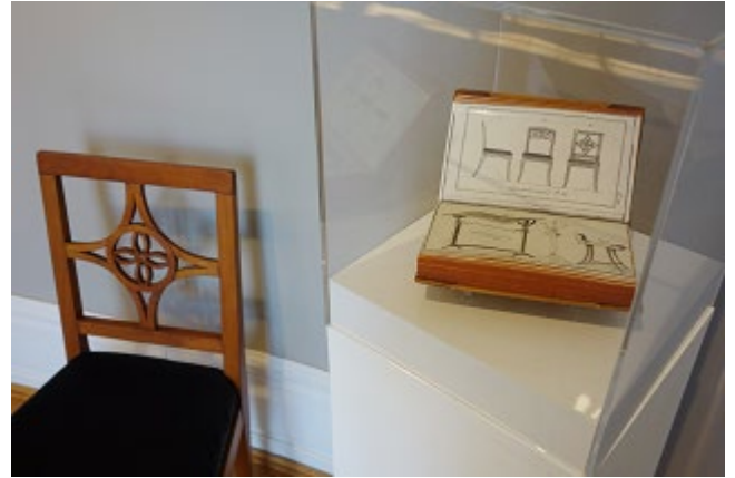
Bild 2 – Stuhl und Sitzbock als Abbildung im „Journal des Luxus und der Moden“