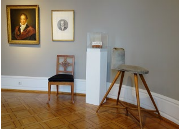
Bild 1 – Stuhl und Sitzbock im Ausstellungskontext