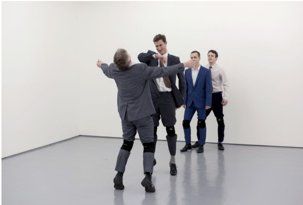
Lucy Beech and Edward Thomasson: Passive aggressive 3 (Public Relations) , 2016, performance for 4 male actors with sound, 4 chairs, laptop, 2 radio microphones, amp, speakers, soundtrack, plastic water bottle, 10 minutes, © Lucy Beech and Edward Thomasson, courtesy Maureen Paley, London

All diese Beispiele bilden erlernte Techniken, die uns vor Gefahren schützen. Während einer Pandemie reicht das Abstandgebot jedoch weiter als 1,5 Meter: „Bleiben Sie zu Hause!“ Das bedeutet: Isolieren Sie sich, vermeiden Sie jeglichen physischen Kontakt, um sich und andere nicht in Gefahr zu bringen. Hören Sie auf, Ihr Leben in sozialer Gemeinschaft zu vollziehen.