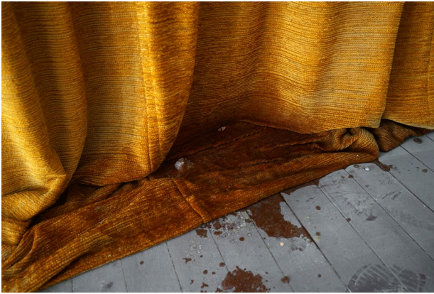
Elisabeth Schröder: Springtime , 2020, Digitalfotografie auf Dia als Projektion, Größe variabel, Courtesy the Artist, Foto: Elisabeth Schröder

Multimedial beschäftigen sich die eingeladenen Künstler*innen mit unserer Gegenwart, mit Veränderungen, Zerfall und Wiederaufbau. Welche Parameter sind konstitutiv für einen Raum, in dem wir uns nicht nur bewegen, sondern auch begegnen können? So ist es nicht verwunderlich, dass die Ausstellung auch den Außenraum der Kunsthalle mit bespielt und so einen ersten Blick in das, was im Inneren geschieht, preisgibt.