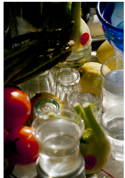
Florian Glaubitz: Series of 12 Untitled photographs, 2020, C-Prints & Handoffset, div. Formats

Zum anderen kommt dem Stern als typografisches Symbol in der deutschen Sprache eine besondere Rolle zu: Als Gendersternchen wird er für eine geschlechtergerechte Sprache eingesetzt – als Verweis auf alle sozialen Geschlechter, die sich außerhalb von weiblich und männlich gelesen definieren. Auch hier lässt sich wieder eine Parallele zur Institution Kunsthochschule als (Schutz-)Raum ziehen, in dem sich Künstler*innen mit sich selbst auseinandersetzen können, der ihnen die Möglichkeit bietet, neue Identitäten, Lesarten über ein binäres System hinaus, über ihre künstlerische Praxis zu erkunden.