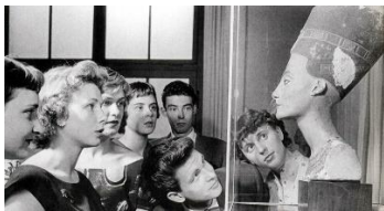
Historisches Foto der ausgestellten Nofretete 1946 Historical photo of Nefertiti on display 1946