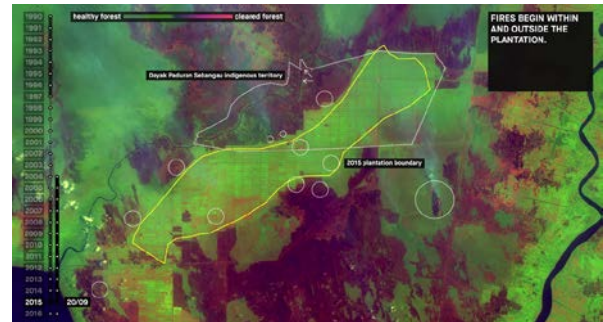
Forensic Architecture: Ecocide in Indonesia , forest fires in 2015, Courtesy: Forensic Architecture in collaboration with FIBGAR

Leerstellen Zeugnis über Eingriffe, Angriffe und Ereignisse ab. Abgesehen von den physischen Qualitäten, können sie sich auch auf Wissens- oder Wahrnehmungslücken beziehen und Informationen schlucken, die wir nicht sehen, hören, verstehen oder einordnen können. Sie können einen Ort beschreiben, der jenseits unseres Vorstellungshorizonts und sinnlichen Zugriffs liegt.