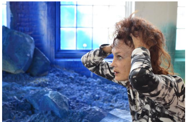
Linda Troeller