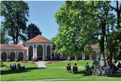
Wandelhalle im Kurpark Bad Boll