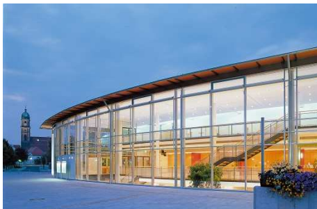
Amberger Congress Centrum