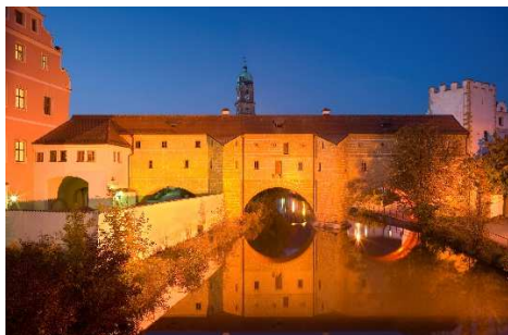
Amberger "Stadtbrille"

Die obenstehenden Bilder, weiteres Bildmaterial und Copyright-Hinweise finden Sie auf unserer Dropbox unter: