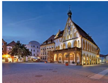
Amberger Rathaus