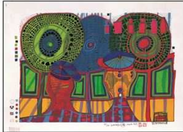
684 Ein Regentag mit Walter Kampmann, Serigraphie, 1969 © 2018 Namida AG, Glarus, Schweiz